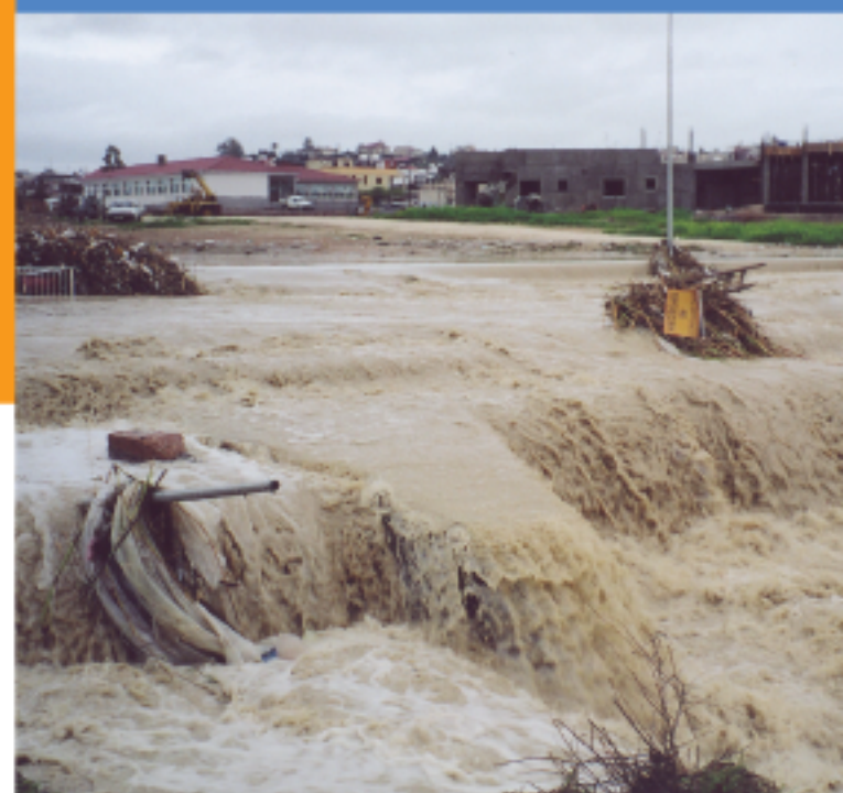
Καταστροφικά αποτελέσματα πλημμύρας (Πεδιός Ποταμός, Λακατόμεια, Λευκωσία)

WDD TAY ΤΜΗΜΑ ΑΝΑΠΤΥΞΗΣ ΥΔΑΤΩΝ www.moa.gov.cy/wdd